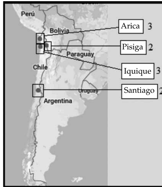
Figura 1 Lugar: ciudad de trabajo de personas entrevistadas

Asimismo, con el fin de obtener mayor información, se realizaron dos entrevistas en grupos o focus group , con 5 participantes en cada grupo focal: